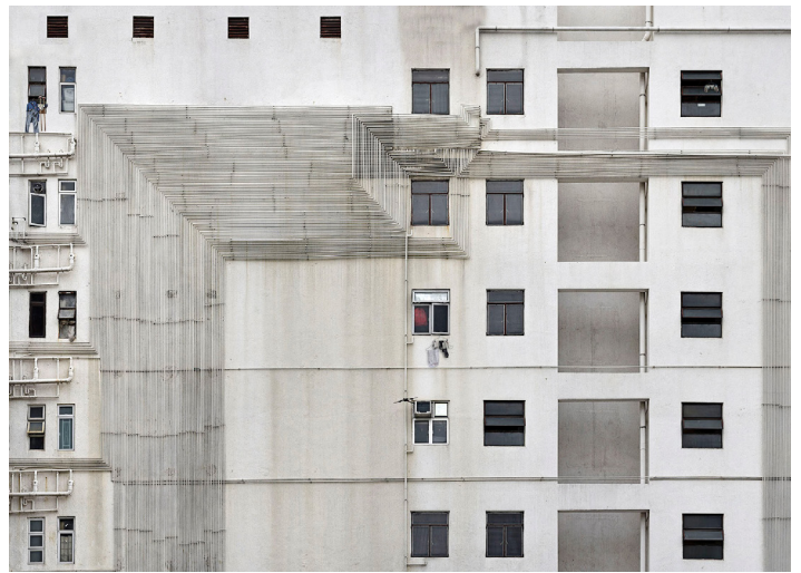
邁克爾·沃爾夫（Michael Wolf），《工業建築 #26》，2015， C- print, 177 x 251cm