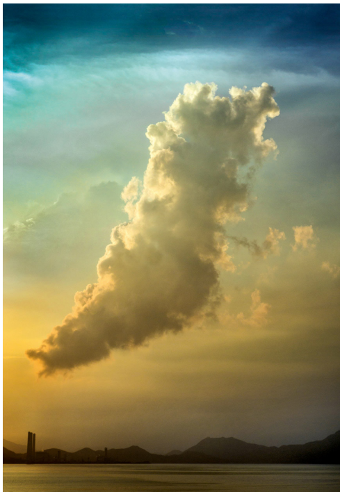
邁克爾·沃爾夫 (Michael Wolf), 《長洲日出 #17》, 2018, 收藏級噴墨打印, 177 x 251cm